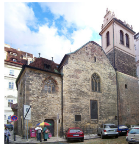
St. Martin in der Mauer, heute die Kirche der deutschsprachigen evangelischen Gemeinde in Prag. Hier wurde 1414 lange vor Luther, Calvin und Zwingli, erstmals der Abendmahlskelch an Laien gereicht, eine wichtige Stätte der Reformation.

Die heutige Evangelische Kirche der Böhmisches Brüder wurde im Jahre 1918 gegründet und entstand aus dem Zusammenschluss von Reformierten und Lutheranern. Diese beiden Kirchen durften sich nach der Gegenreformation erst wieder entfalten, als 1781 in der Habsburger-Monarchie ein Toleranzpatent dies erlaubte. Allerdings gab es massive Einschränkungen, insbesondere was die Kirchen anbelangte. Diese durften nicht als Kirchen bezeichnet werden und mussten Bürgerhäusern ähnlich sehen, der Eingang durfte nicht von der Hauptstrasse aus erreichbar sein und ein Turm mit Glocken war undenkbar.