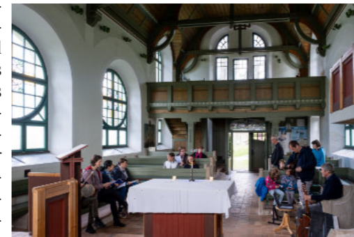
Die evangelische Kirche von Herlikovice im tschechischen Riesengebirge

Die Situation in Tschechien unterscheidet sich sehr deutlich sowohl von Deutschland, wie auch von anderen Ländern. Finanzielle Schwierigkeiten sind allgegenwärtig. Die Pfarrer beziehen zu 80% ihr Gehalt vom Staat, den Rest deckt ein landeskirchlicher Fond in den alle Gemeinden einzahlen, die auch einen Pfarrer haben. Das überfordert viele Gemeinden, obwohl insgesamt auch das Gehalt eines Pfarrers sehr gering ist. Besoldete Kirchenmusiker gibt es in der Regel nicht, Hauptträger der kirchlichen Arbeit sind Ehrenamtliche. In vielen Gemeinden gibt es eine engagierte Jugendarbeit, die Pfarrer erteilen Religionsunterricht auch an Schulen und es wird versucht, eine ständige diakonische Arbeit zu leisten. Alles immer auch unter dem Aspekt der Mission in